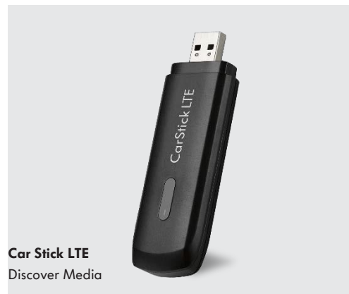
Car Stick LTE Discover Media