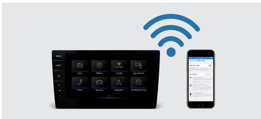
Usługi Car-Net za pośrednictwem hotpotu Wi-Fi Discover Pro i Discover Media