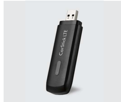
LTE Carstick Discover Media