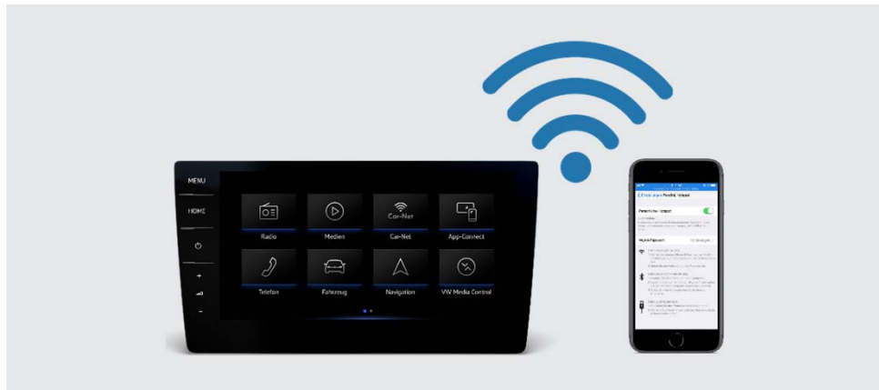
Car-Net über WLAN Discover Pro und Discover Media