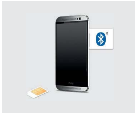
Mobiltelefon-Schnittstelle „Premium“ Discover Pro

Für die Nutzung von Car-Net muss das Infotainmentsystem online sein. Hier sehen Sie die verschiedenen Verbindungstechnologien um eine Internetverbindung aufzubauen.